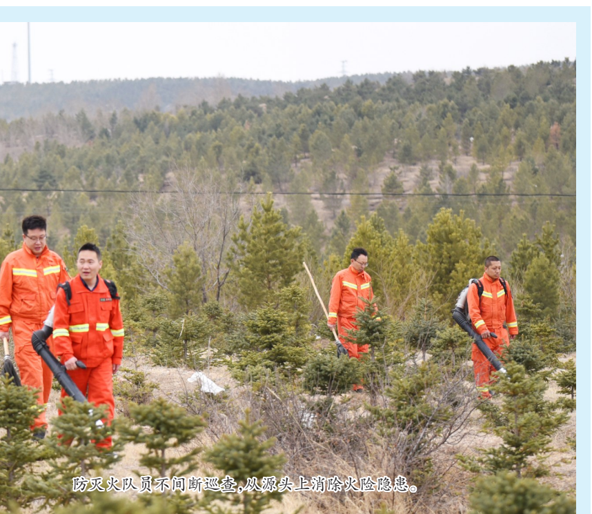
防火队员不间断巡查，从源头上消除火灾隐患。

“店子村委会于2018年开始，就通过打井配套流转土地等方式，使集体经济收入达到5万元，实现了村集体经济清零递增的目标。”杨振峰表示，自2020年起，店子村利用光伏收益、普育和卓养殖有限公司的土地占用费以及机电井管理费收入，使年收入达到了67.5万元，成功帮助80户贫困户脱贫致富，并且为村民提供了就近就业的机会。2023年的村集体收入已经达到了81.4万元。