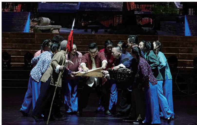
●东路二人台《战地黄花》演出照片

“58年来,察右中旗乌兰牧骑以铸牢中华民族共同体意识为根本方向,传承乌兰牧骑优良传统,扎根草原,服务农牧民,积极传递党的声音,扎实推进民族团结进步工作。今后我们将继续创作更多优秀节目,积极传递党的声音,努力续写新时代辉煌锡勒草原红色文艺轻骑兵的传奇故事。”察右中旗乌兰牧骑负责人说。