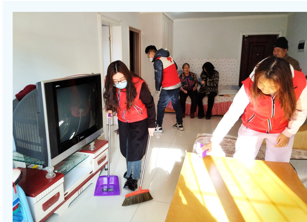
▲ 为孤寡老人打扫卫生

——加强养殖保险和减灾保收工作。坚持“政府引导、市场运作、自主自愿、协同推进”的基本原则,全面推动保险工作健康发展,不断提升养殖保险服务水平。截至11月,养殖保险共为604户养殖户承保牲畜3.87万头,其中承保牛8748头,共计保费661.9万元,已赔付545.3万元,赔付率达82%。针对今年北部牧区遭受的旱灾情况,政府提前发放各类惠农奖补资金,采取多项措施减少牧民损失,累计为北部3个苏木共计发放草原生态奖补资金3871.92万元,受益2786户。下发2023年草原生态保护补助奖励资金6124.41万元,共有6874户农牧民受益。同时,给予全旗农牧户肉羊50元/只出栏补贴,肉牛300元/头出栏补贴。截至11月,肉羊肉牛出栏114.46万头(只),饲养量达270万头(只),比上年增长3.8%,牛羊业总产值13.74亿元,同比增长3.89%,占畜牧业产值的91.2%,比上年增长5.3%,充分保障了市场牛羊肉供给和农牧民收益。