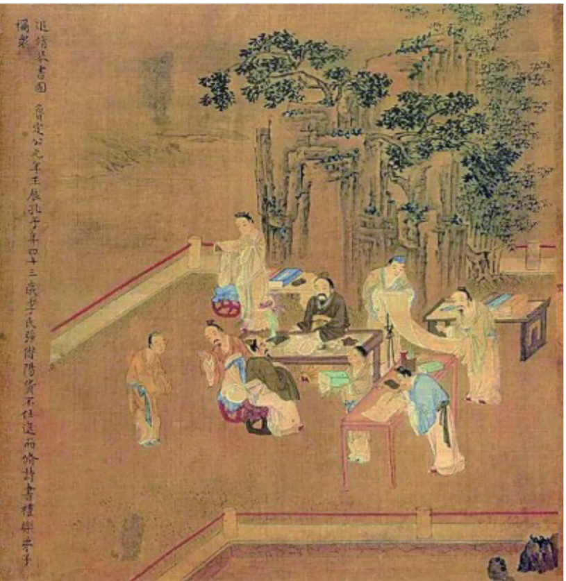
孔子圣迹图·退修琴书图