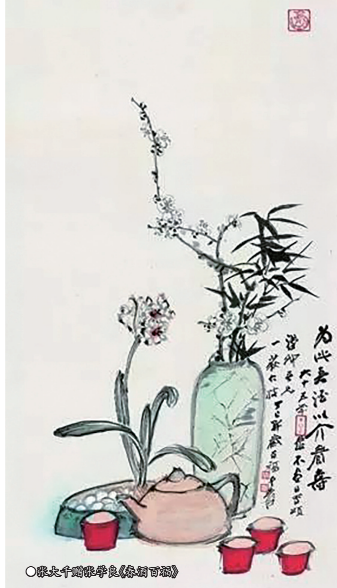
张大千赠张学良《春酒百福》

原箱: 是指铅封未开。 整箱: 是指原箱的把铅封打开了,但里边的东西未动,称为整箱。本报综合报道