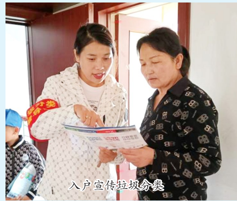
入户宣传垃圾分类

近日,集宁区前进路街道繁荣社区在辖区内开展以“倡导文明风尚 践行垃圾分类”为主题的生活垃圾分类宣传活动。 活动中,工作人员热情地向居民派发生活垃圾分类宣传册,讲解垃圾分类的重要意义和垃圾分类投放的技巧常识,解答居民关于垃圾分类和环境保护方面的问题,倡导大家从日常生活入手、从小事做起,争当垃圾分类的宣传者、参与者。