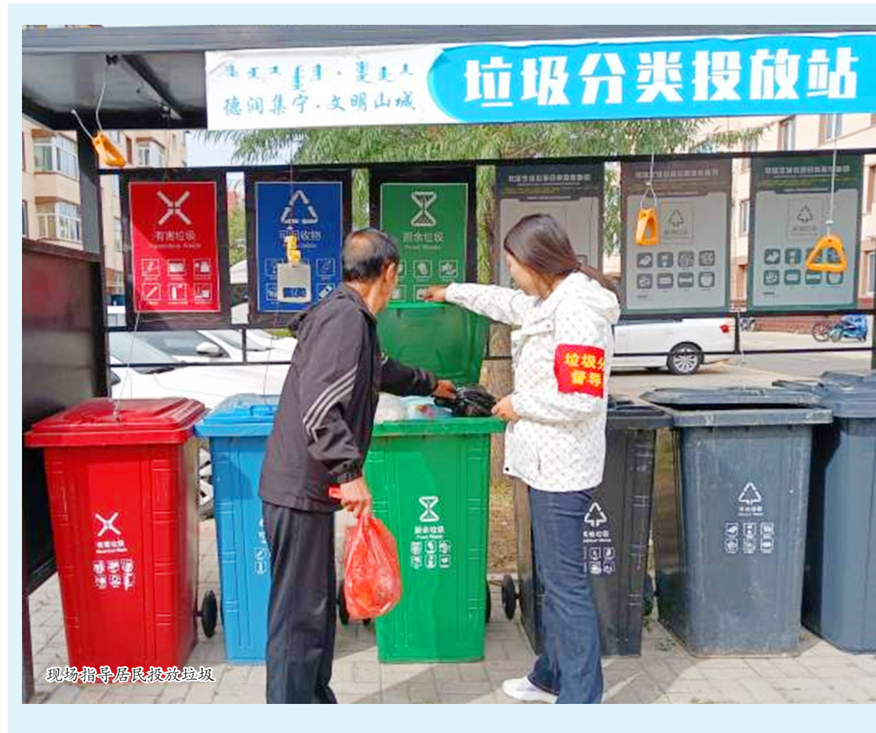
现场指导居民投放垃圾

事,为我们紧扣战略定位,进一步做好各项工作指明了方向和路径,极大提振了广大干部建设亮丽内蒙古的信心。 中铁四局集大铁路项目党总支书记熊向进表示,全体干部职工将紧紧围绕“学思想、强党性、重实践、建新功”的总要求,结合实际细化工作措施,高标准、高质量推进各项工作,争取集大铁路项目取得新成绩、迈上新台阶。